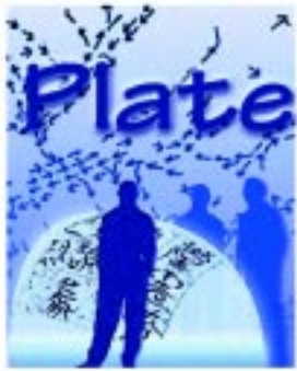
Plate-forme pour l'avenir lance la Semaine internationale des apprenants adultes

Par le passé, les matières premières, le capital et la main d'oeuvre étaient les plus importantes ressources de la race humaine. Dans le monde de demain, les ressources les plus importantes seront la connaissance et l'information. Les sociétés qui auront du succès vont promouvoir l'imagination, la créativité et la connaissance de leurs membres pour améliorer les conditions et la qualité de vie. « Plate-forme pour l'avenir » est une portion du Dialogue global « Bâtir les sociétés éducatives: – Savoir, information et développement humain » de l'exposition mondiale Expo 2000 qui a lieu présentement à Hanovre en Allemagne. La Journée internationale de l'alphabétisation sera célébrée lors de cet événement. De plus, elle proclamera la Décennie de l'alphabétisation des Nations Unies et, finalement, elle annoncera la Semaine internationale des apprenants adultes . Cette initiative de l'UNESCO vise à faire connaître des témoignages d'apprenants, des histoires révélatrices et des images du monde entier.