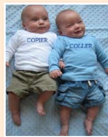
de vrais jumeaux

Les jumeaux fraternels (70 %) sont plus communs que les vrais jumeaux (30 %). Dans le cas des jumeaux fraternels, deux œufs sont fécondés. Toutefois, dans le cas des vrais jumeaux, un œuf fécondé se dédouble pour donner des jumeaux identiques à la naissance. La photo ci-dessus est une autre façon de faire comprendre ce que sont de vrais jumeaux. Il y a 20 ans, aurait-on compris le message transmis par cette photo?