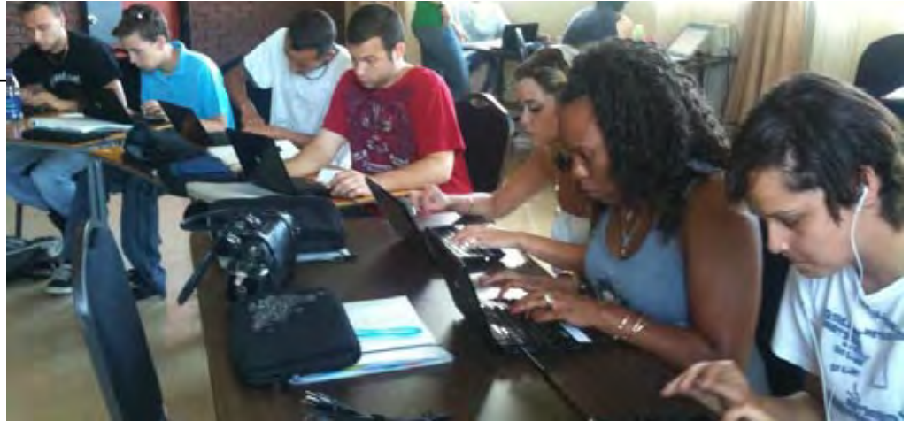
Jeunes ambassadeurs et ambassadrices du savoir (voir page 12)

D'abord, l'ICÉA propose de « reconnaître la diversité des lieux et des expériences d'apprentissage qualifiant », autant les apprentissages survenant dans le cadre de la formation scolaire que ceux réalisés par des voies non scolaires. Il importe aussi de développer « une approche large des types de connaissances et de compétences » pouvant potentiellement contribuer à la qualification des jeunes. Il s'agit ici de connaissances et de compétences autant génériques que spécifiques. Pour l'ICÉA, une telle approche large implique nécessairement d'« améliorer l'accès à la reconnaissance des acquis et des com-