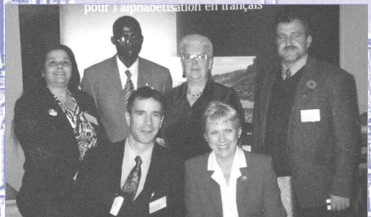
Les membres du comité des apprenants en compagnie de la sénatrice Joyce Fairbairn

• « Nous avons besoin d'un plan d'action pour l'alphabétisation. Vous pouvez nous aider en tant que parlementaires en écrivant une lettre d'appui à notre demande à la ministre Jane Stewart. »