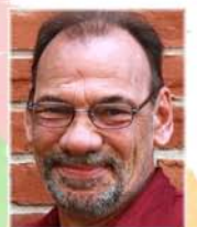
Rock Brisson du Yukon et représentant des personnes apprenantes au conseil d'administration de la FCAF