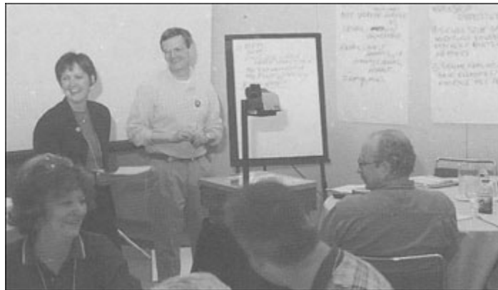
Programme d'éducation offert au centre de formation de la section locale 832 des TUAC à Winnipeg.