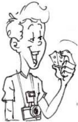
Dessin : Guy Dubé

L'été dernier, moi ainsi qu'un groupe de participantEs de Clé Montréal sommes allés à Warwick dans le cadre du Festival du fromage de Warwick.