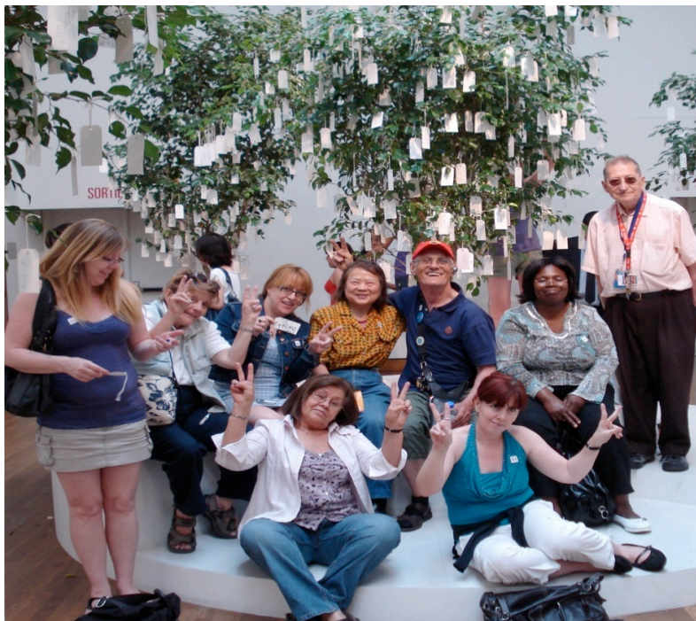
Une petite pause après avoir accroché son message de paix dans les arbres.