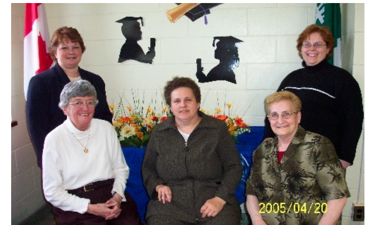
Les membres du comité :