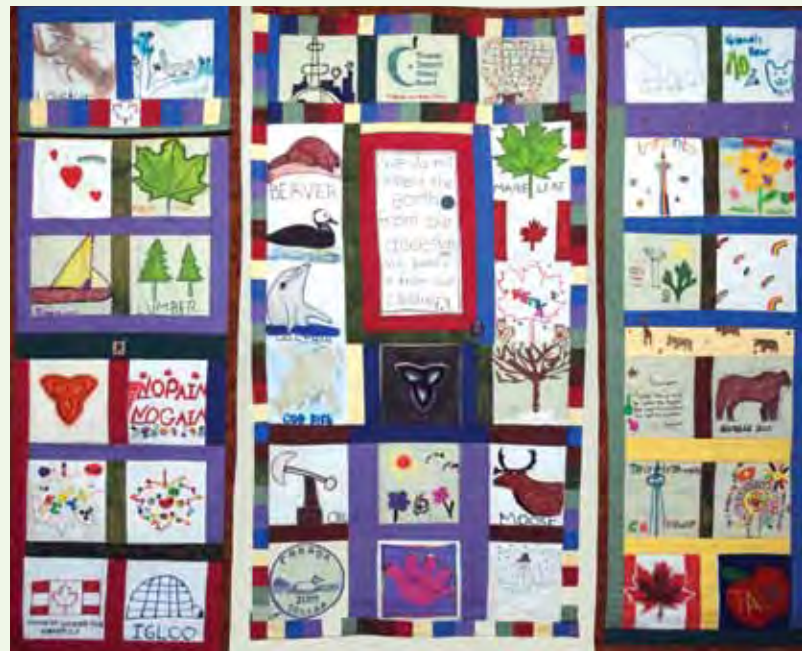
La brochure intitulée From Rags to Riches raconte l'histoire derrière chaque carré de la courtepointe.

Les groupes d'apprenants adultes locaux ont mis en marche une collaboration mondiale d'apprenants au service de l'apprentissage. Ce récit montre comment les apprenants des différentes régions du monde mettent en commun leurs idées et leurs connaissances, et coopèrent en vue d'atteindre un objectif commun – l'éducation pour tous – sans aucune exception.