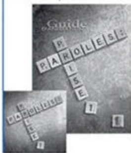
Paroles : prise 1, cahier et dc